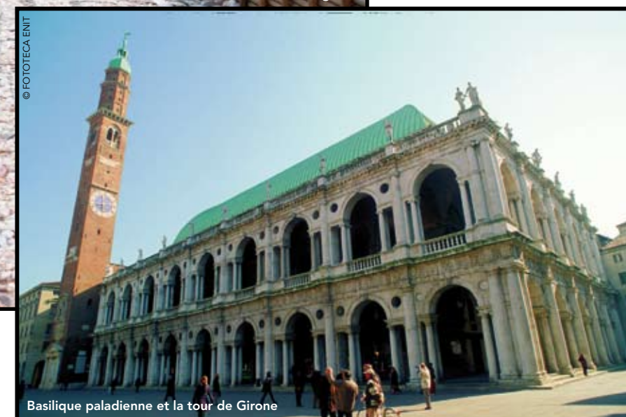
Basilique paladina et la tour de Giron

Au sein de ce carré vient s'inscrire un cercle qui symbolise quant à lui le macrocosme, l'univers, le monde spirituel. L'homme et la nature doivent vivre en harmonie et Palladio s'inspira aussi de la nature pour ses projets. Ce même plan carré, il l'a repris dans le sens vertical pour obtenir un cube parfait, qu'il a coiffé d'une coupole évoquant l'hémisphère du Panthéon à Rome. Sous ce dôme, le hall central circulaire occupe un double étage et prend des allures de cathédrale. C'est donc une construction intellectuelle qui est à l'origine du plaisir visuel éprouvé par le visiteur.