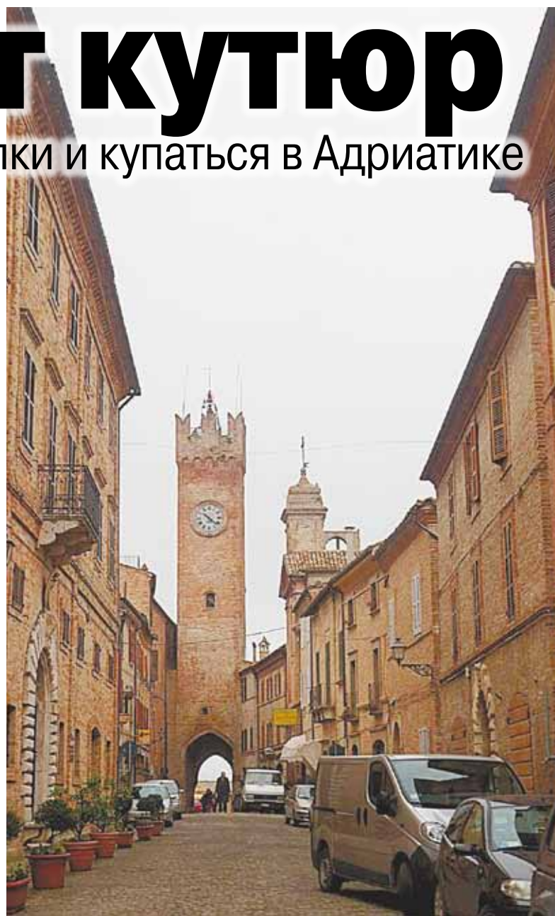
На какую улочку ни сверни, попадёшь в красивое место.