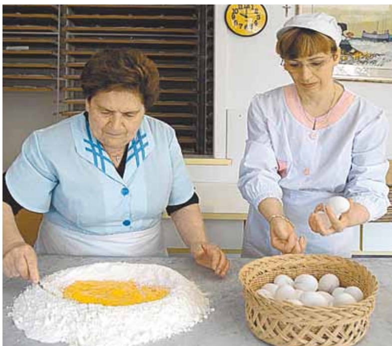
Капофилоне - родина маккерончини, тонкой яичной лапши.

Городок Мореско славится тем, что несколько раз в год устраивает незабываемые праздники. Средневековые ужины со столами на сотню человек, факельным освещением, блюдами по традиционным средневековым рецептам и местным вином в последнюю пятницу июля или Праздник котла в последнее воскресенье октября .