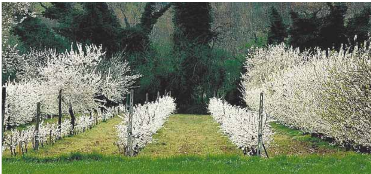
Весной здесь всё в цвету! Но этот кусочек Италии прекрасен в любое время года.

гулять по старинным улочкам, делать покупки и купаться в Адриатике