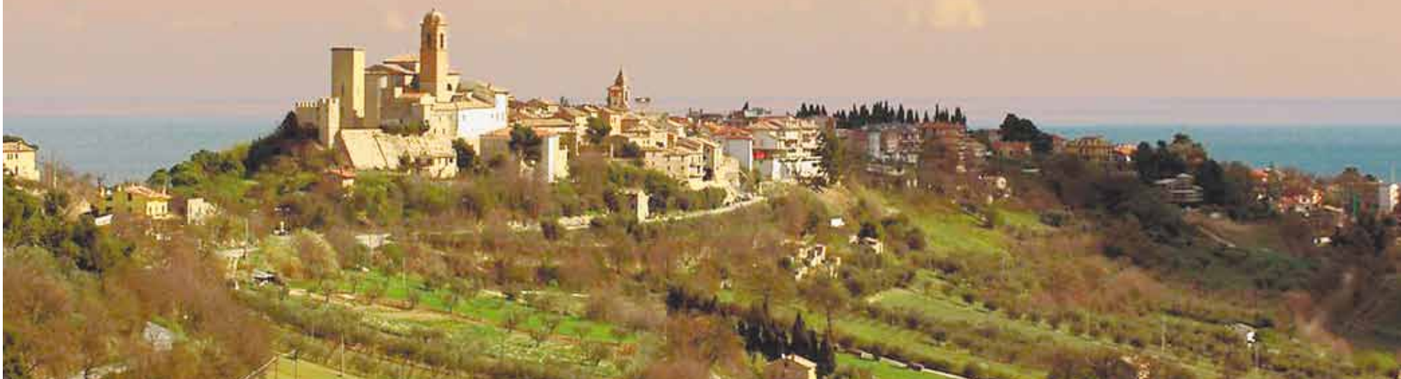
На каждом холме - старинный городок со своей многовековой историей.

В Марке - регионе на тыльной стороне итальянского сапога - можно