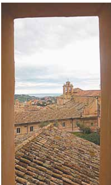
Море всё время ускользает из виду. Но оно рядом, где бы вы ни гуляли. Чтобы «услышать» запахи Адриатики, достаточно вытянуть носом воздух.

Руины древнеримского театра (Anciente Roman Theatre) видим в городке неподалёку от Фермо. Называется он Фалероне . Кстати, летом в театре проводят концерты. Классическая музыка в тени вековых деревьев - что может быть прекраснее для вечернего досуга на