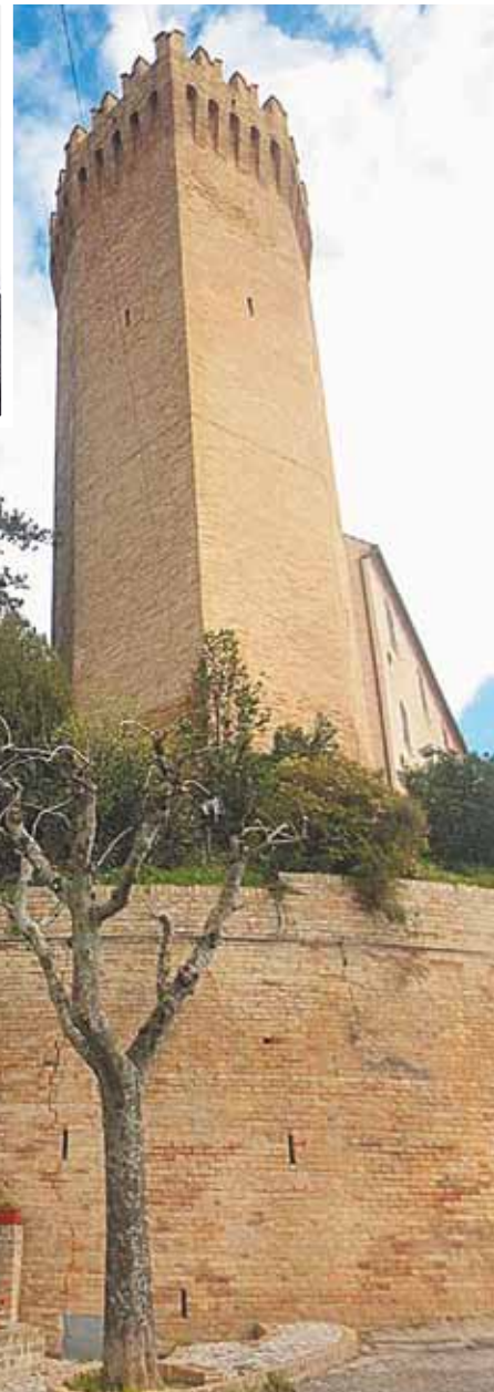
Если повезёт, экскурсию в башню (Heptagonal Tower) проведёт мэр города Мореско Амато Меркури. Да, этот замок продаётся. 600 тыс. евро - и он ваш!