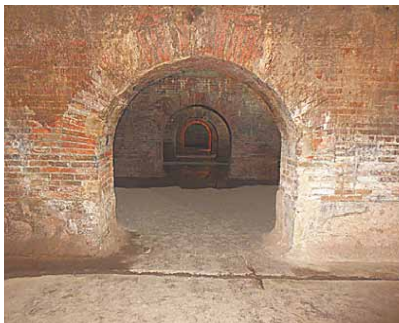
Римские цистерны использовали для сбора и хранения воды вплоть до 1980 г.

Фермо - столица одноимённой провинции в южной части региона Марке. До побережья Адриатического моря несколько километров. Конечно, если вы предпочитаете «овощной» морской отдых в отеле, работающем по системе «всё включено», можете дальше не читать. А если вы из числа продвинутых путешественников, то не сможете не остановиться здесь. Тем более этого буквально требует само название: «Fermo!» по-итальянски значит «Стоять!» или «Остановись!».