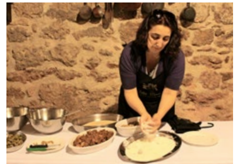
Ascoli Picenossa sijaitsevassa Villa Cicchissä valmistuu marchelaisherkku olive all'ascolana.