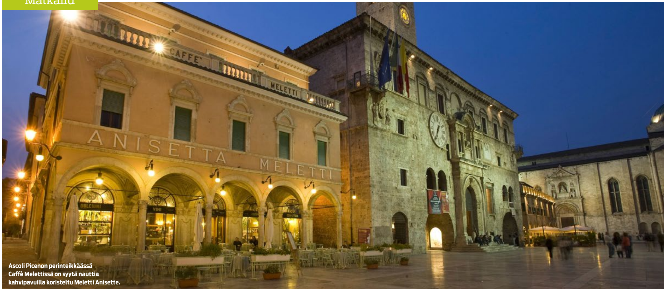
Ascoli Picenon perinteikkäässä Caffè Melettissä on syytä nauttia kahvipavuilla koristeltu Meletti Anisette.