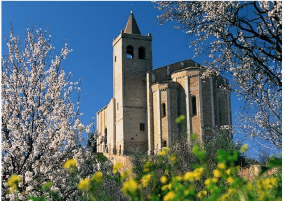
Korkealle rakennettu Santa Maria della Rocca -kirkko toimii myös Offidan maamerkinä.