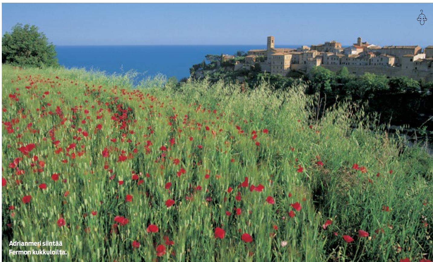
Adrianmeri siintää Fermon kukkuloilta.