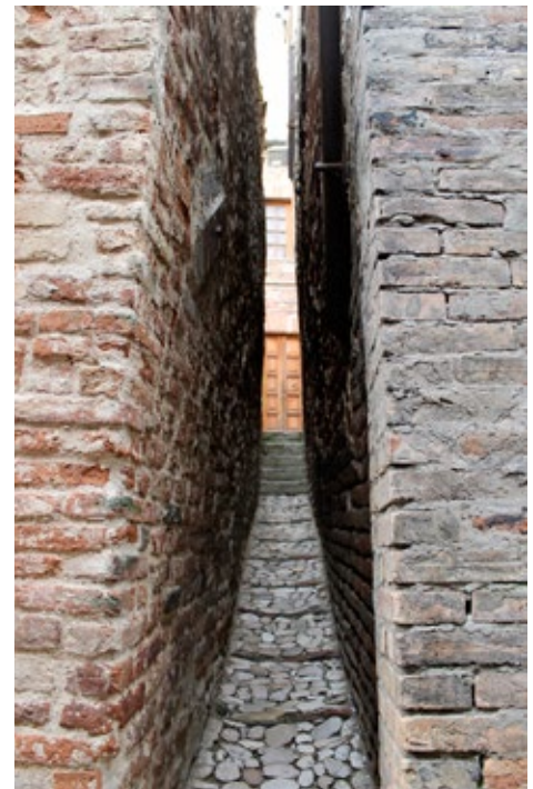
Ripatransonen kujilla ei liikoja leveillä.

JUO: viinitila Le Caniette, www.lecaniette.it ●